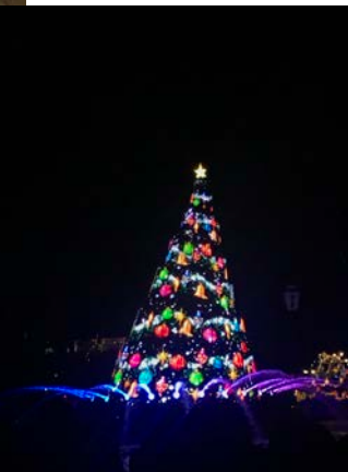
◎ディズニーマップングによるツリー