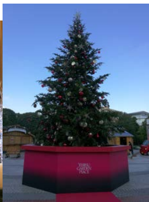
◎恵比寿 (ガーデンプレイス)