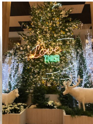
◎二子玉川 (高島屋デパート)