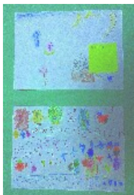
↑通信でおなじみ mapleさん